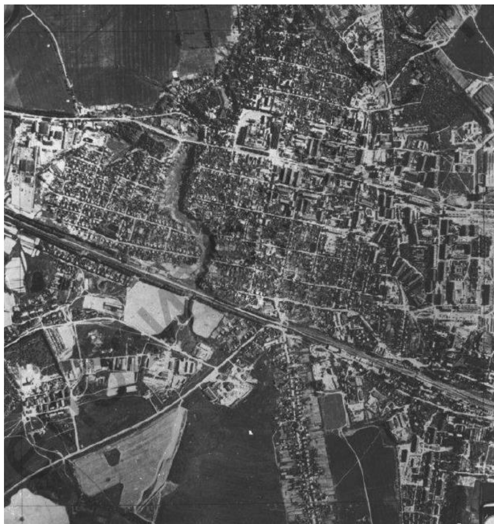
Рис. 9.2 Фрагмент аэрофотоснимка города

Для закрепления изученных признаков необходимо проанализировать фрагмент аэрофотоснимка (рис. 9.2).